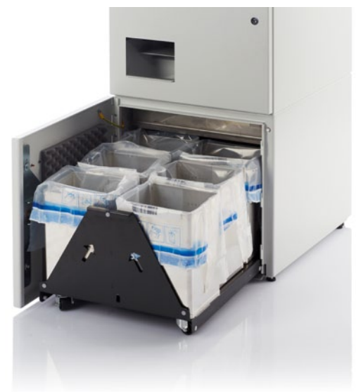
Münzwagen mit Safebags