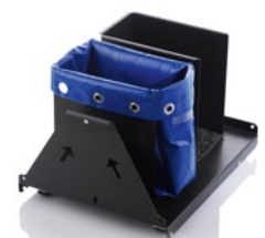
Münzwagen mit Mehrweg-Taschen